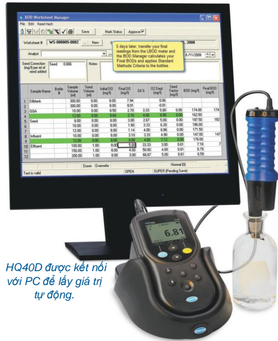
HQ40D được kết nối với PC để lấy giá trị tự động.

Bằng việc tự động hóa các bước thông thường và việc tính toán, Hach BOD Manager cho bạn sự tự tin rằng dữ liệu của bạn được ghi nhận một cách chính xác. Dữ liệu điện tử thu thập được kết hợp tính toán và kiểm tra sai số nhằm giảm thiểu sai sót thông thường khi sao chép và phân tích dữ liệu theo cách thủ công.